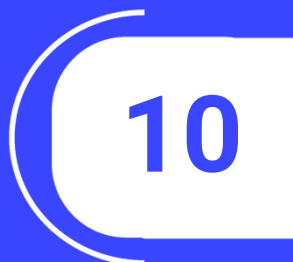
Tabla de impuesto a la renta (Especiales)

Registra la tabla de descuentos para personas con capacidades especiales, determinando las deducciones aplicables según el porcentaje de discapacidad.